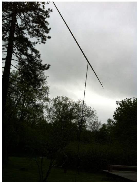
Rolf Lieberknecht im Garten seiner Villa mit seinen windkinetischen Skulpturen.